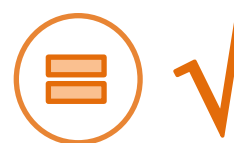
Tabla N° 6

Libro de actas legalizado al Comité de la Persona Joven entre los años 2012 y 2018